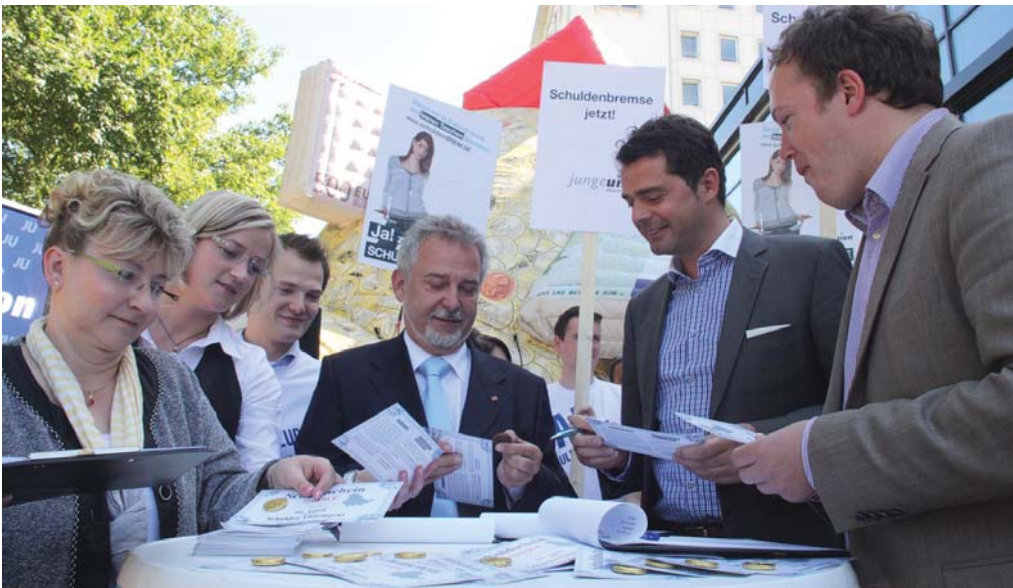
Ja zur Schuldenbremse! Die CDU-Landtagsfraktion unterstützte eine Aktion der Jungen Union (JU) Thüringen für eine Schuldenbremse in der Landesverfassung. Mit einem sechs Meter hohen Schuldenberg hatte die JU vor dem Thüringer Landtag für die Schuldenbremse geworben. CDU-Landtagsabgeordnete beteiligten sich an der Unterschriftenaktion für die Petition.